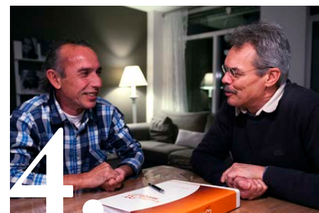
Vijf voorbeelden van smaakmaken