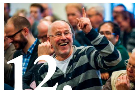
Leden krijgen een stem