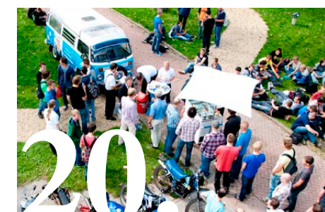
Knokken voor iedere stem