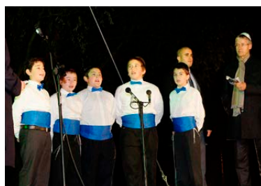
Arie Slob bij de viering van het Chanoeeka feest in Nijkerk.