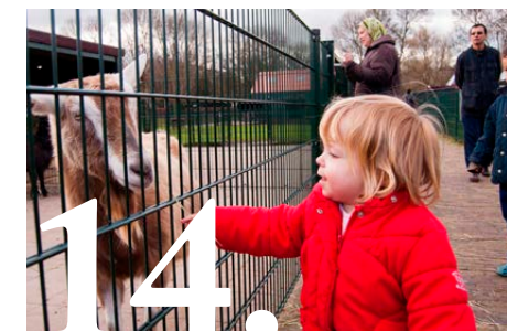
Participeren doe je samen