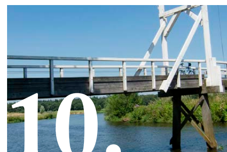
Herindelingsverkiezingen geven hoop