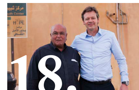
Vredestichters in Israël